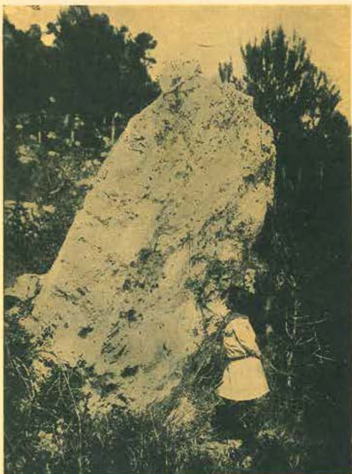
EL MENHIR DE CABRERA